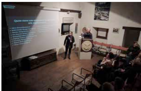
8. Un arqueólogo canadiense hablando de su trabajo en Canadá (SFA, 2014).