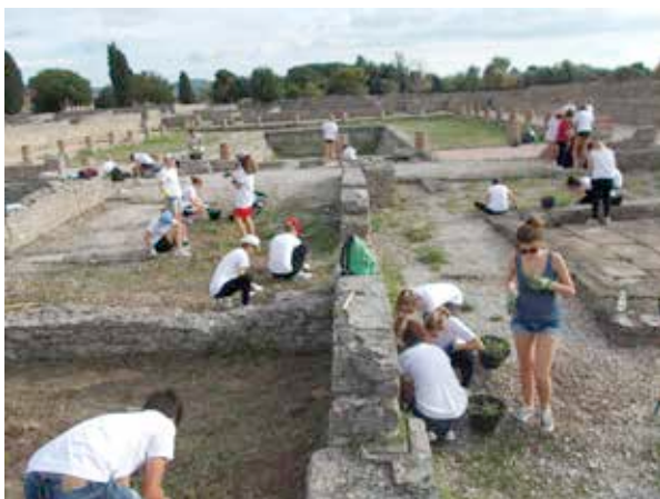
3-4-5. Las actividades de la SFA con la comunidad y las escuelas en Udine, Paestum (SA) y Aquileia.

Acceder cada vez a más datos y nuevas informaciones, procedentes de otros lugares de Europa, es un valor añadido para compartir, que la SFA potencia. El Friuli Venezia Giulia es una región en una zona muy cercana al centro de Europa por la que pasaron muchas culturas influyentes en el pasado (romanos, lombardos...). Aún hoy se pueden admirar vestigios muy importantes en el Friuli Venezia Giulia, como la ciudad romana de Aquileia con su basílica paleocristiana o Cividale con el "tempietto longobardo" del siglo VIII (pueblo recién declarado Patrimonio de la Humanidad por la Unesco), una de las ciudades más importantes del Reino Lombardo. La posibilidad de disponer de una página web y de una página en Facebook ha permitido mostrar nuestras