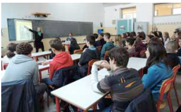
7. La lección en Inglés de una arqueóloga polaca en una clase de preparatoria después de haber presentado su tesis en la SFA (Pinagli, 2014).

El proyecto está abierto a todos los jóvenes, italianos y extranjeros, que hayan escrito una tesis, Trabajo Fin de Grado o Trabajo Fin de Máster, sobre cualquier tema de carácter arqueológico (desde la Prehistoria hasta la Edad Media) y que tengan interés en presentar sus trabajos en la sede de la SFA en Udine. Este proyecto ha sido pensado para dar a conocer a los aficionados a la arqueología algunos aspectos poco conocidos, pero muy interesantes y dar la oportunidad a los jóvenes investigadores para profundizar en sus estudios y, tal vez, para crear nuevas colaboraciones. Con este espíritu, los jóvenes investigadores del Friuli, de Italia o del extranjero; con sencillez y competencia, desde el 2012 han presentado su trabajo a un público cada vez más diferente e interesado (Pinagli et al. , 2013).