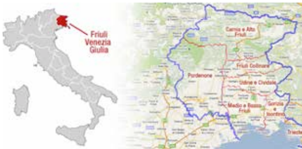
1. La posición del Friuli Venezia Giulia en Italia.

“El patrimonio de una comunidad se compone de personas que valoran aspectos específicos del patrimonio cultural que desean, en el marco de la acción pública, mantener y transmitir a futuras generaciones” (Faro Convention, Art. 2 b 27.X.2005).