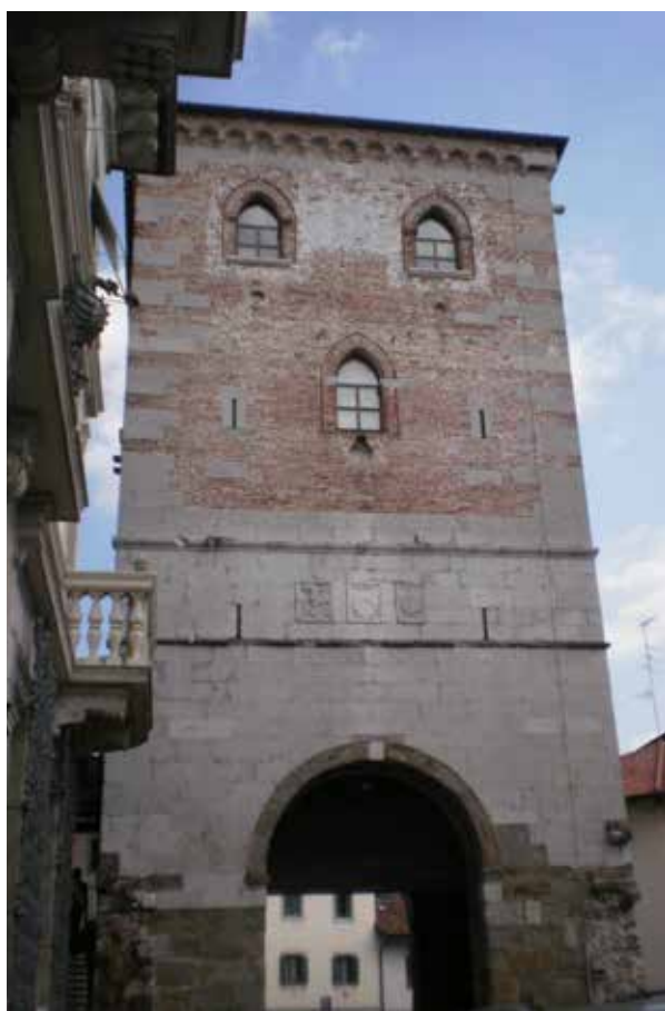
2. La sede central de la SFA en Udine.

“La SFA considera que el voluntariado, si bien guiado y apoyado por las autoridades, es un arma poderosa en la defensa y la difusión del conocimiento del patrimonio nacional” (Pinagli et al. , 2013, p. 30). Esta asociación cuenta con especialistas en diferentes campos de la arqueología, con una gran experiencia de trabajo efectivo y con apasionados que casi siempre son los mejores expertos de su propio territorio y por tanto, los mejores guardianes de su patrimonio cultural (Pinagli et al. , 2013). Actualmente, la SFA cuenta con más de 500 miembros, muchos arqueólogos, conservadores y especialistas en diversas áreas, de forma que se ha convertido en una de las primeras realidades culturales del voluntariado en toda Italia.