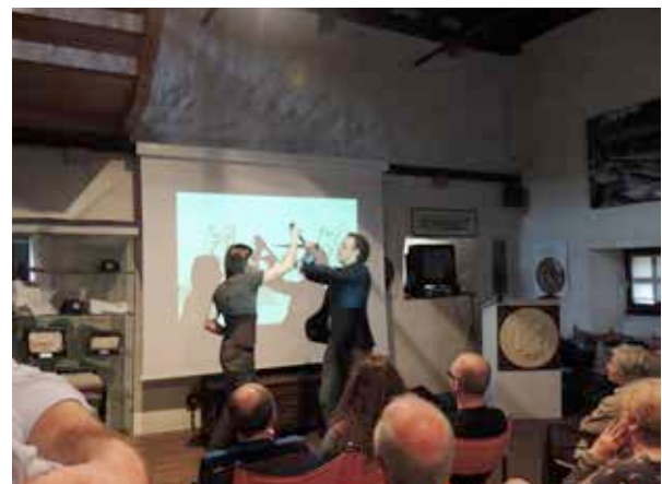
11. La actividad en colaboración de la asociación Regio Turrus (Pinagli, 2014).

A estos encuentros se han unido también otras asociaciones culturales regionales que han presentado su visión acerca de cómo hacer arqueología y cómo difundirla. La SFA pudo colaborar con la asociación Regio Turrus mostrando al público el arte de la esgrima histórica para conmemorar a uno de los más importantes maestros europeos en esta destreza: Fiore Furlano de Cividale d'Austria, delli Liberi da Premariacco que nació en Cividale en el siglo XIV. En junio de 2015 el proyecto se unió a una iniciativa del Ayuntamiento con la asociación de Udine con motivo de la "Jornada Mundial del Juego". La SFA consiguió que jóvenes licenciados explicasen los juegos de la época egipcia y de la medieval tanto en un periodo de