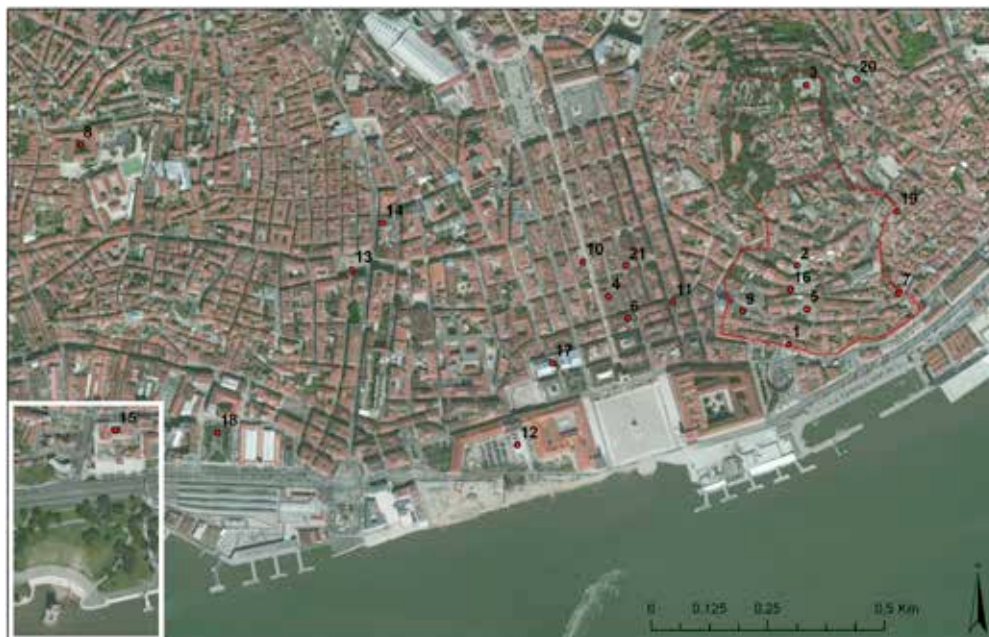
3. Sítios arqueológicos visitáveis em Lisboa: mapa.

Parece evidente que um tal aumento de visibilidade tem necessariamente que se traduzir numa diferente percepção de Lisboa como sítio arqueológico, junto do grande público. Avaliar a dimensão da mudança e caracterizar, nas suas diversas dimensões, a informação e conhecimento que efectivamente passam para a generalidades dos cidadãos e visitantes é um trabalho muito complexo que permanece por empreender. Pode contudo afirmar-