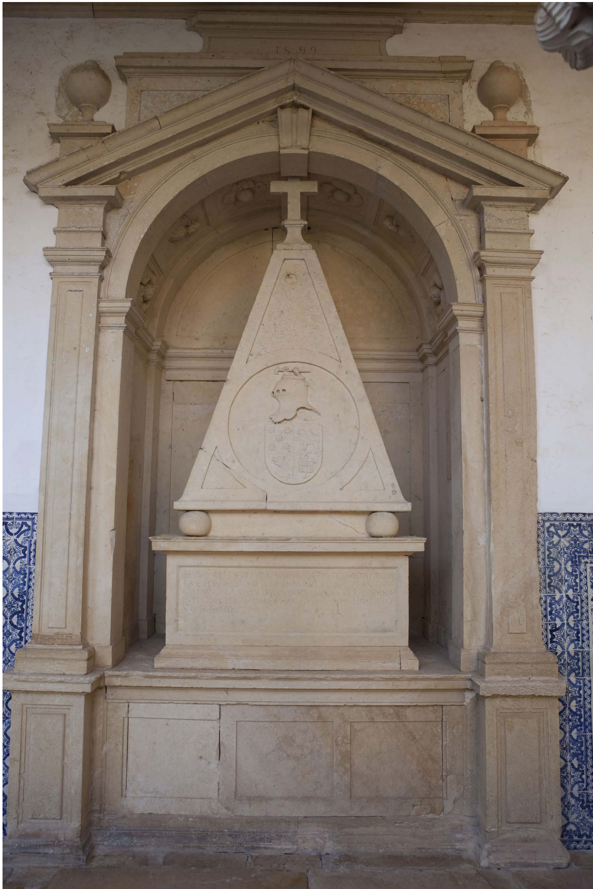
Túmulo de Pedro Álvares de Freitas, Vigário de Tomar, no Convento de Cristo